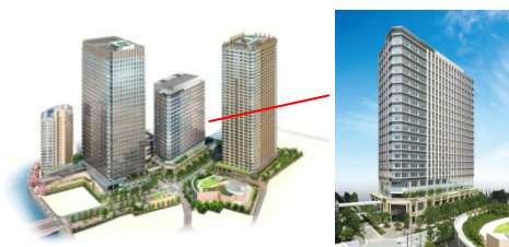
《大崎駅からのアクセス》