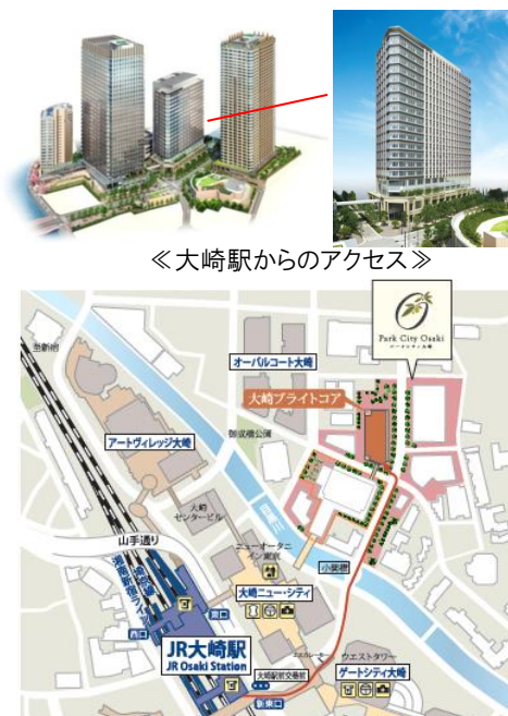
《ビジネスを支える抜群の交通利便性》